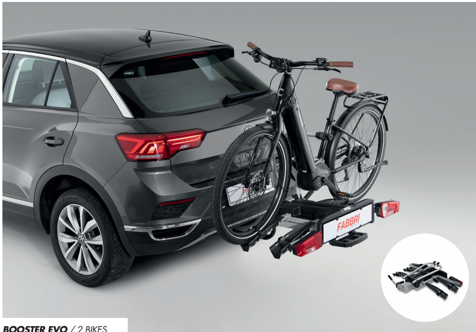
BOOSTER EVO / 2 BIKES

TOW HOOK BIKE CARRIERS - PORTABICI DA GANCIO TRAINO