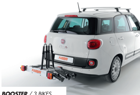
BOOSTER / 3 BIKES

Fabbri Portatutto presenta Booster, il nuovo portabici da gancio traino adatto per chi cerca la semplicità di un entry level e la qualità che da sempre contraddistingue tutti i prodotti Fabbri. Disponibile nella versione 2 E-bike e 3 e 4 bici, tutte dotate di tilting system per poter facilmente accedere al bagagliaio.