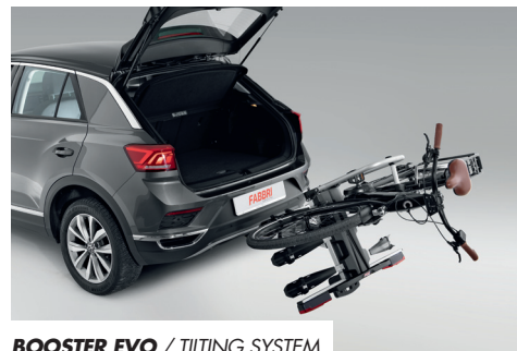
BOOSTER EVO / TILTING SYSTEM