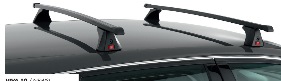
VIVA 10 / NEWS!

Rectangular section (30x20 mm) roof bars in steel with PVC sheathing. Suitable for cars with smooth roof (without railing). Suitable for a wide range of car models, thanks to the specific fixing kits.