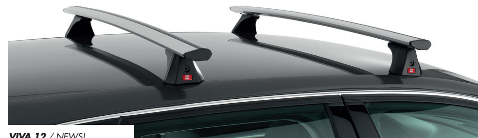
VIVA 12 / NEWS!

Roof bars in aluminum for cars with smooth roof (without railing), with dedicated fixing kit specific for each car model. Available in aluminum and black finishing. Prepared for the assembly of any roof accessory, with "T" track slot.