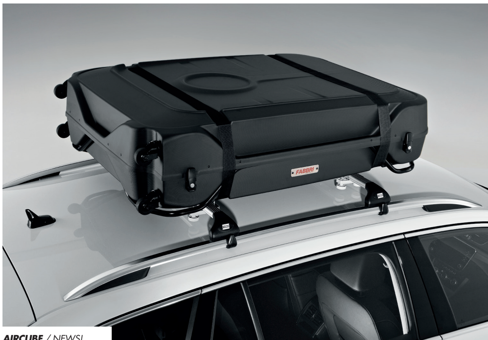
AIRCUBE / NEWS!

BIKE TRANSPORT CASE - CONTENITORE PER TRASPORTO BICI