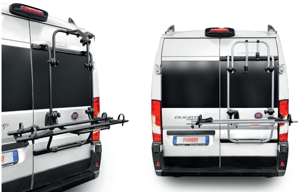
BICI OK MTB VAN2

HATCHBACK BIKE RACKS - PORTABICI DA PORTELLONE