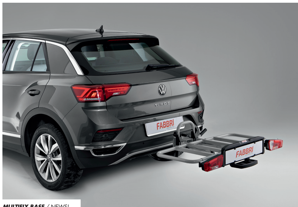
MULTIFIX BASE / NEWSI

Multifix is the free tow hook loading platform by Fabbri Portatutto, designed to satisfy every transport need thanks to its integrated and interchangeable options. A real modular system consisting of a platform that can be integrated with a bicycle rack accessory, a loading tray or a large loading trunk, all equipped with a tilting system for quick access to the boot, and fixing on tow hook with lever.