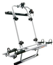
BICI OK MTB VAN2 BLACK - NERO