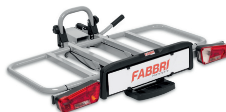
MULTIFIX BASE / Cod. 6201700