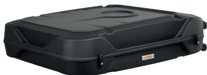
AIRCUBE BLACK - NERO cod. 6503701

Aircube è un contenitore innovativo creato per trasportare la bicicletta in modo pratico e al sicuro da possibili urti e graffi. L'obiettivo è quello di offrire una soluzione definitiva per il trasporto bici. Infatti, il sistema Aircube è in grado di trasportare in maniera intuitiva e semplice una bicicletta di qualsiasi tipo, sia da corsa che Mountain Bike (da 26" a 29") e qualsiasi misura di telaio.