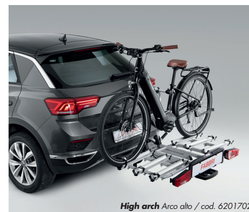
High arch Arco alto / cod. 6201702