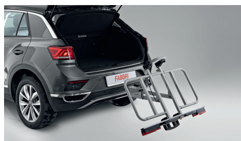
MULTIFIX Tilting system / Sistema a ribalta

Multifix è la piattaforma di carico libero per gancio traino di Fabbri Portatutto pensata per soddisfare ogni esigenza di trasporto grazie ai suoi optional integrabili ed intercambiabili. Un vero e proprio sistema modulare composto da una piattaforma integrabile con accessorio portabici, vassoio portatutto ed un ampio baule di carico, il tutto dotato di tilting system per un rapido accesso al bagagliaio, e di attacco su sfera con leva.