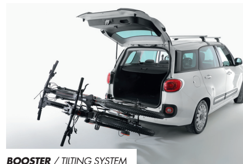
BOOSTER / TILTING SYSTEM