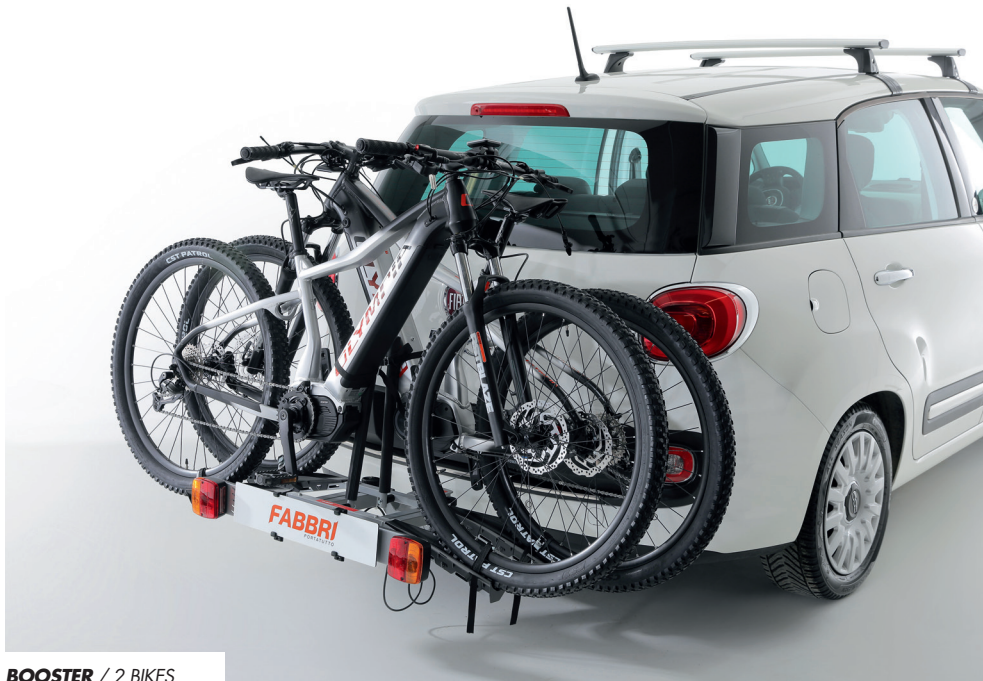
BOOSTER / 2 BIKES

TOW HOOK BIKE CARRIERS - PORTABICI DA GANCIO TRAINO