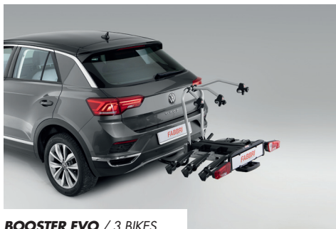
BOOSTER EVO / 3 BIKES

Portabici da gancio traino con struttura in acciaio verniciato a polvere, adatto al trasporto di bici ed e-bike da 20" a 29", portata massima 50 Kg per la versione a 2 bici e 60 Kg per la versione a 3 e 4 bici. Pratico, grazie all'attacco su sfera con leva e tilting system a pedale, l'arco posteriore è ripiegabile per un facile rimessaggio, ed è dotato di rotelle per lo spostamento del portabici in fase di caricamento e installazione.